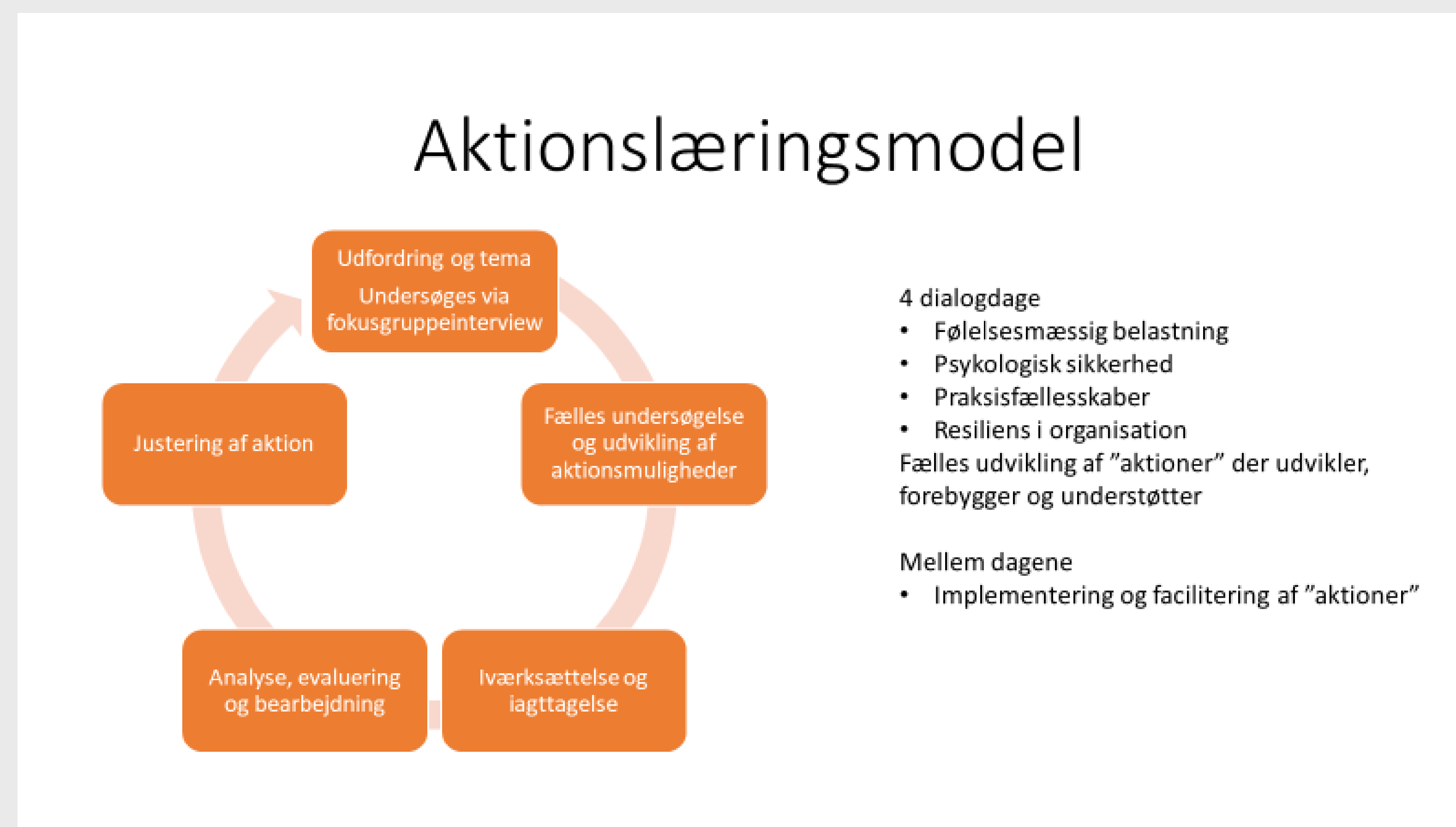
Figur 2 : Er en model hvor man løbende vurderer initiativer og justerer undervejs blandt medarbejder og projektgruppen